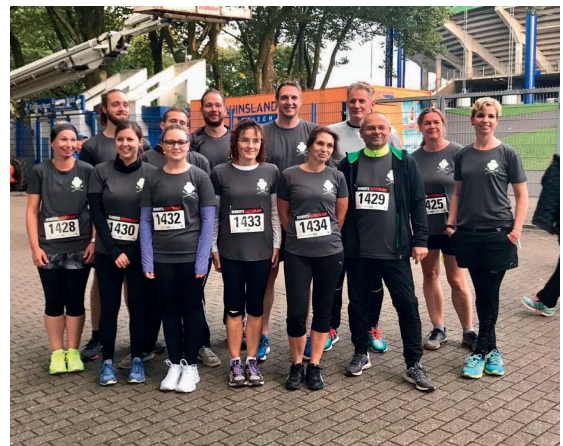
MLD-Teilnehmer beim Lichterlauf