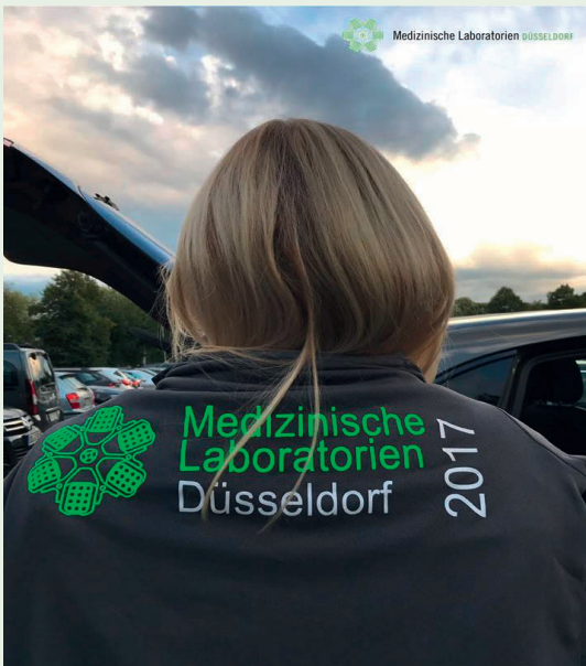
Labor Düsseldorf beim Lichterlauf